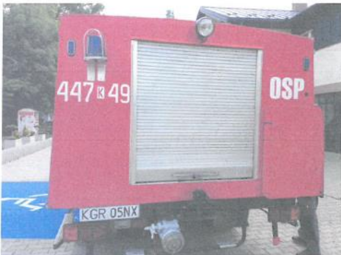
Widok ogólny pojazdu